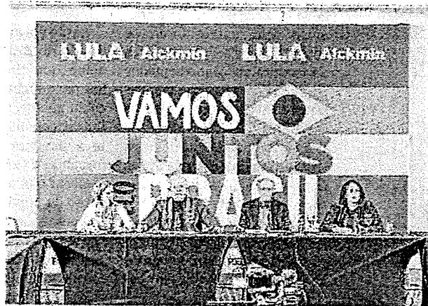
LULA e Alckmin lideraram ontem 1ª reunião da coordenação da campanha

O senador Randolfe Rodrigues (Rede-AP), coordenador da campanha de Lula, disse que "assim que o programa estiver pronto, ele, Lula, vai procurar o presidente da Fiesp, e vai levar o programa para debater com eles". "Ele vai conversar com