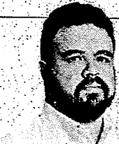
ESTA COLUNA É PUBLICADA DE TERÇA A SÁBADO