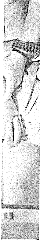
ARIELY, 4 anos, tomou vacina contra a gripe ontem

A campanha contra a gripe se estende no Ceará até 31 de maio de 2024. Apenas em Fortaleza, a expectativa é que 90% do grupo prioritário seja imunizado até o fim do período, ou seja, em torno de 946.903, segundo afirmou a SMS.