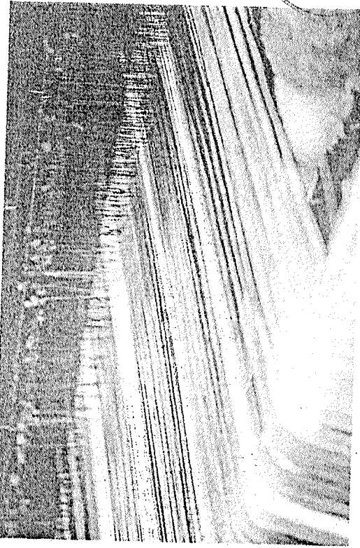
FABRICAÇÃO artesanal de redes em Jaguaribara. Setor de confecção sofre para contratar mão de obra