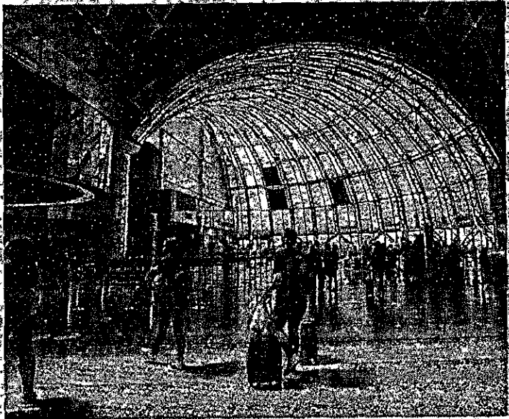
STJ julgou que cancelamento fere Código de Defesa do Consumidor