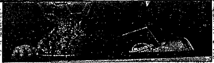
Luka Modric acabou com os 10 anos de domínio de Cristiano Ronaldo e Messi no prêmio de melhor do mundo