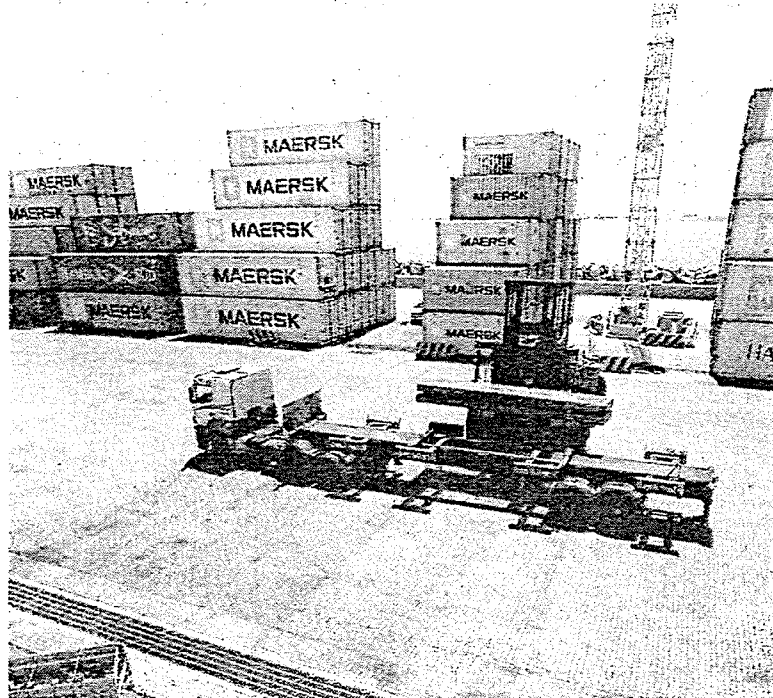
SETOR de "ferro fundido, ferro e aço" liderou as exportações em 2023 com US$ 640 milhões

Em relação às importações, o Ceará movimentou US$ 287,2 milhões em julho deste ano. Diminuição de 11% em relação a junho deste mesmo ano, mas uma alta de 3% ante igual ne-